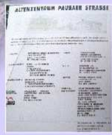
14. Juli 1995 - das Richtfest wird gefeiert

Auf verschiedenen Messen präsentiert sich die AWO Zeulenroda mit ihren Einrichtungen und Angeboten.