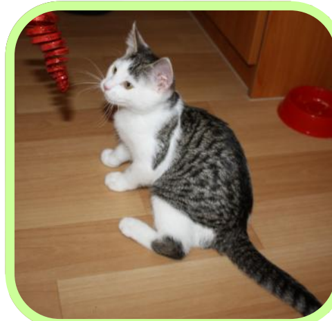
Lorchen ist in der Wohngruppe „Fliederweg“ zuhause.

Es wurde auch erforscht, wie sich die Haltung von Katzen auf Menschen mit Demenz in einem geschlossenen Wohnbereich auswirkt. Nach vier Monaten zeigte sich, dass die Bewohner des geschlossenen Bereichs, die Katzen um sich hatten, im Vergleich zur Kontrollgruppe aufgeweckter waren. Die Tiere sorgten für Ablenkung, die Bewohner sahen ihnen zu und redeten über sie. Die Pflegebedürftigkeit nahm bei diesen Bewohnern – im Gegensatz zu den Senioren des Kontrollbereichs – nicht zu. Im „Katzenbereich“ fiel zudem auf, dass die Bewohner mehr Lebensfreude zeigten (lachen, lächeln). Die Atmosphäre wurde gemütlicher, und auch Besucher und Pflegenden fühlten sich wohler.