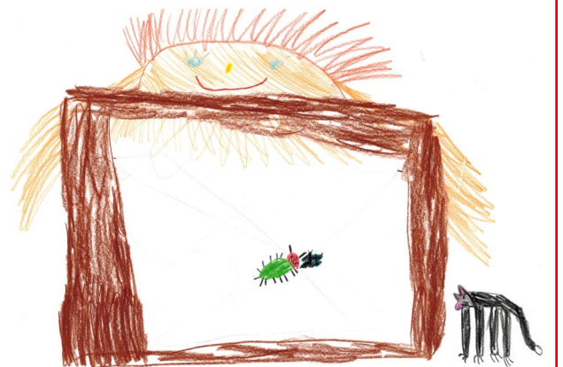
Jette malte den Kampf der Spinne mit einer Fliege.

Unsere Spielstelle im Wald nutzen die Kinder aktiv zum Spielen und Bewegen, bauen sich z.B. Höhlen, reiten auf gesammelten Ästen (Steckenpferd) oder nutzen einen Baumstamm als Auto, um damit in die Welt zu reisen. Dabei entwickeln sie ihre Fantasie und Kreativität und nutzen Naturmaterial anstelle industriell gefertigter Spielsachen.