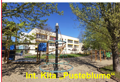
Int. Kita „Pustebblume“

Liebe Eltern, bitte melden Sie Ihr Kind rechtzeitig in einer Kita Ihrer Wahl an. Der Anspruch soll in der Regel 6 Monate vor der beabsichtigten Aufnahme in die Einrichtung geltend gemacht werden. Am besten ist es, wenn der Antrag kurz nach der Geburt des Kindes, gern aber auch früher, gestellt wird, um eine Betreuung ab dem gewünschten Zeitpunkt sicherzustellen. Vereinbaren Sie doch bitte einen Termin mit der zuständigen Leiterin in einer unserer Kitas: