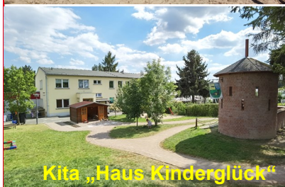
Kita „Haus Kinderglück“